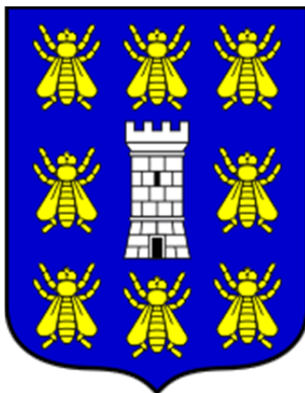
Slika 2: Općina Ražanac www.opcina-razanac.hr