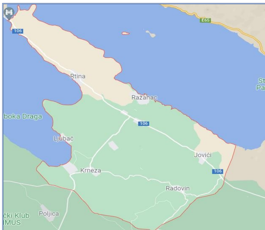
Slika 3: Karta Općine Ražanac